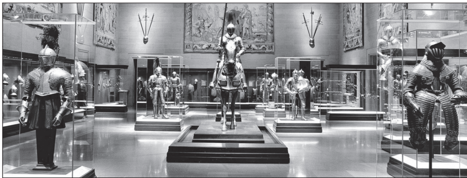
MODERN IN DESIGN - PRESTIGIEUS IN KWALITEIT - ERVAREN DOOR TRADITIE

In het kader van de verder geplande internationale expansie en ter ondersteuning van de Gedelegeerd Bestuurder, is er dringend behoefte aan versterking van de organisatie met een ervaren, dynamische en gekwalificeerde Projectmanager.